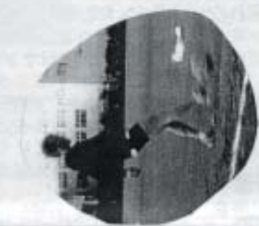
100回と 御愛を唯一り受取!!