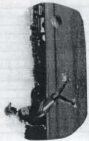
初参加 身体能力は高い!!