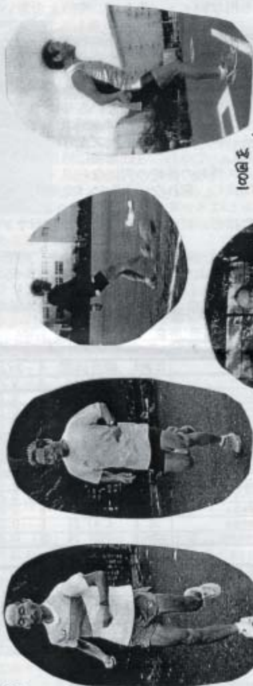
7年間は悪いかタイムは一番!!