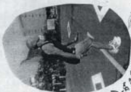
前回は 多く跳んだが 順位が2位→3位へ