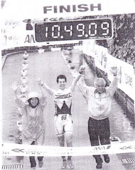
五島 長崎 国際トライアスロン大会 2011.6.19

(レース後見ると、普通のコースだった。あまりの辛さに平地が坂道に見えたようだ。)