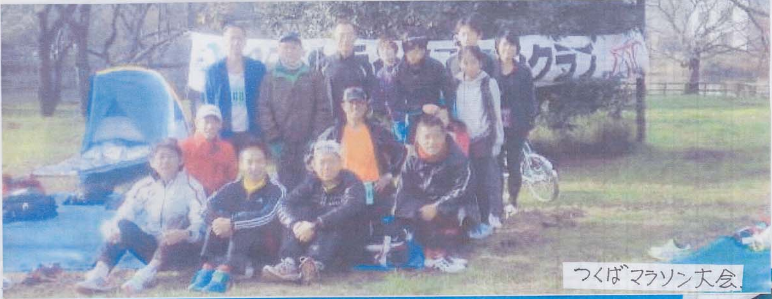
つくばマラソン大会