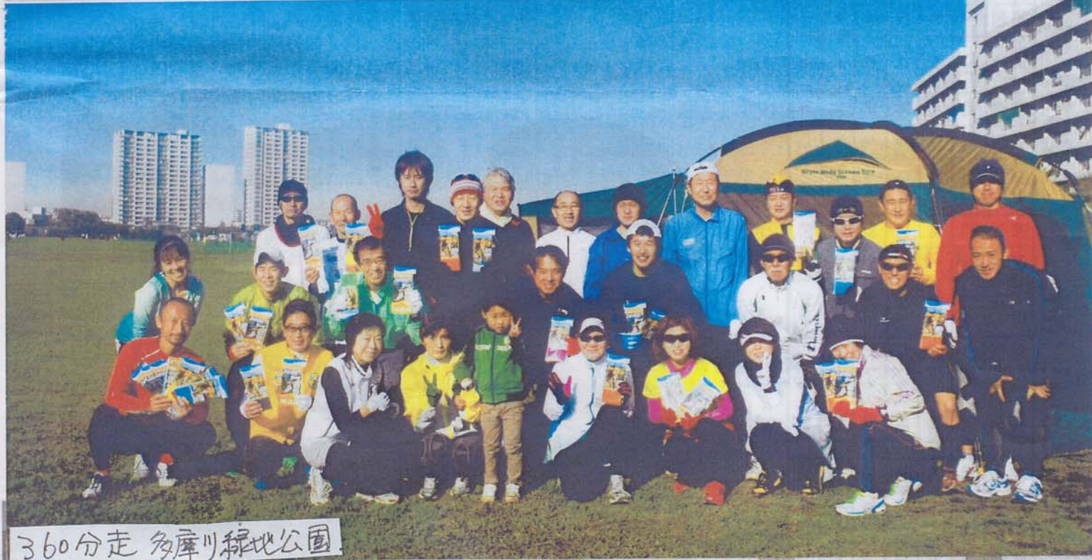
360分走 多摩川緑地公園