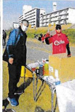
スタート地点に設けたエイドステーション